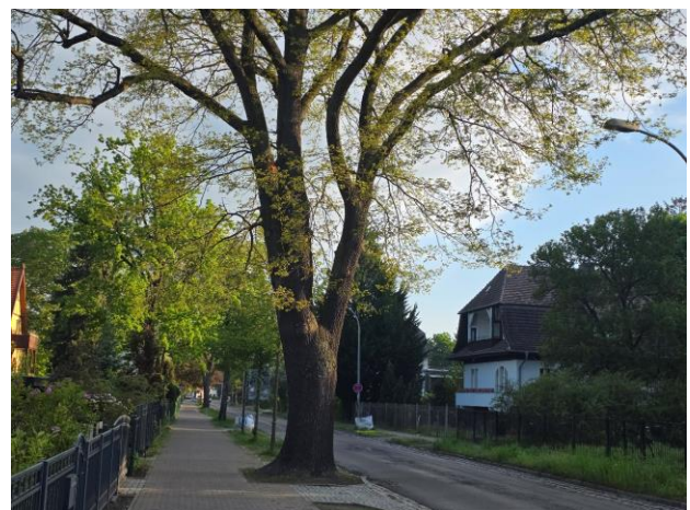
Fotos: Baumbestand in der Rudolf-Breitscheid-Straße